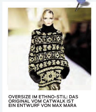
OVERSIZE IM ETHNO-STIL: DAS ORIGINAL VOM CATWALK IST EIN ENTWURF VON MAX MARA