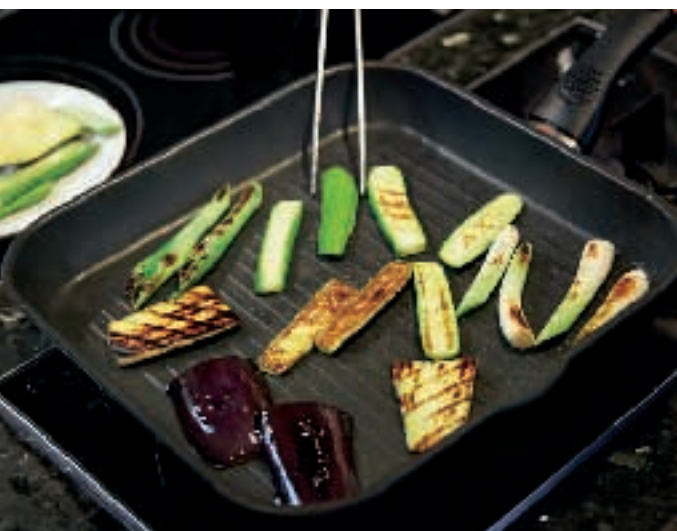
Das Gemüse wird in einer Grillpfanne kräftig angebraten