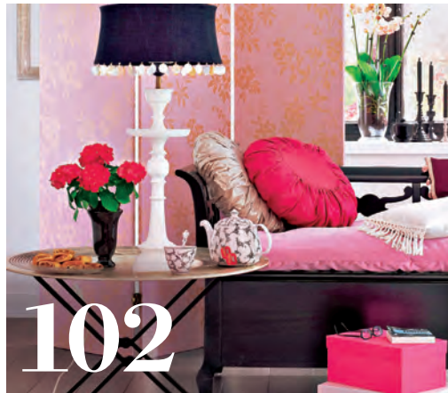
Entspannung: mit Yoga zur Wunschfigur