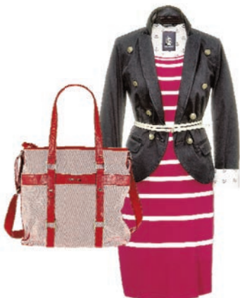
Bestform 40+ Der Marine-Look für Ladies SEITE 26