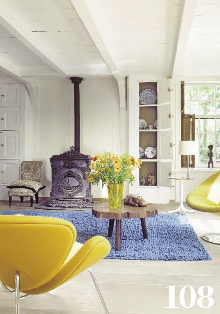
Wohn-Träume: Design trifft Baudenkmal