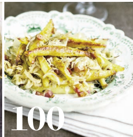
Schupf-Nudeln: Kartoffel liebt Kraut